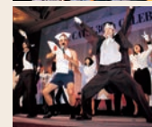
恒例となった地区別演芸大会。各地区のメンツをかけ、奇抜な衣裳やダンスで会場は爆笑の渦に