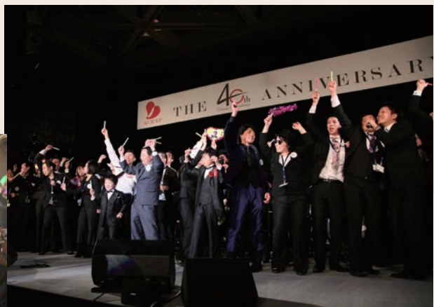
式典のフィナーレは、ステージにあがり大盛り上がり