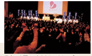
日本一を願い、声をあわせたシュプレヒコール