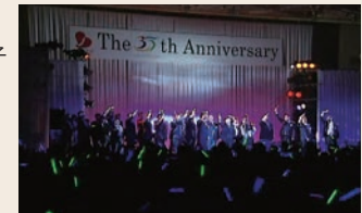
全従業員による大合唱で感動のフィナーレへ