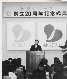
企業規模、社員数が大きく拡大するなかで行われた創立20周年記念式典