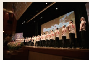
チェンジ&チャレンジ宣言