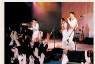
「加瀬邦彦とザ・ワイルドワズ」をゲストに迎え、全社員一体となって盛りあげました