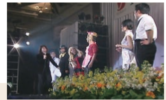
威信を賭けた地区別演芸大会