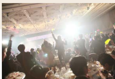
会場の盛り上がりもピークに!