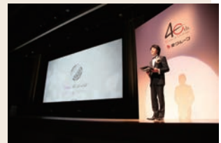
新作ブランド「THE LOVEL」の発表