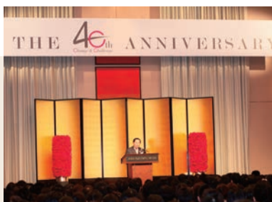
式典の挨拶をする神田代表