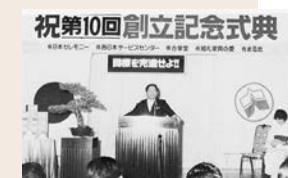
HIT A TARGET (目標を完達せよ)をテーマに次のビジョンを定めた創立10周年記念式典