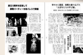
15周年記念パーティ記事