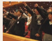
目標完達を祈願し、全員でシュプレヒコール