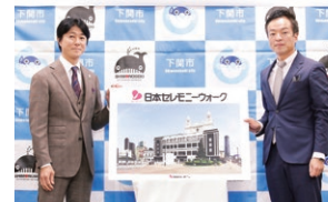
ネーミングライツ契約締結式

中高生に魅力をアピール 「ものせき未来創造jobフェア」 海峽メッセ下関で開かれた「ものせき未来創造jobフェア」に出展し、中高生に地元企業の魅力をアピール。翌朝の山口新聞に“注目を集めた企業”として掲載されました。